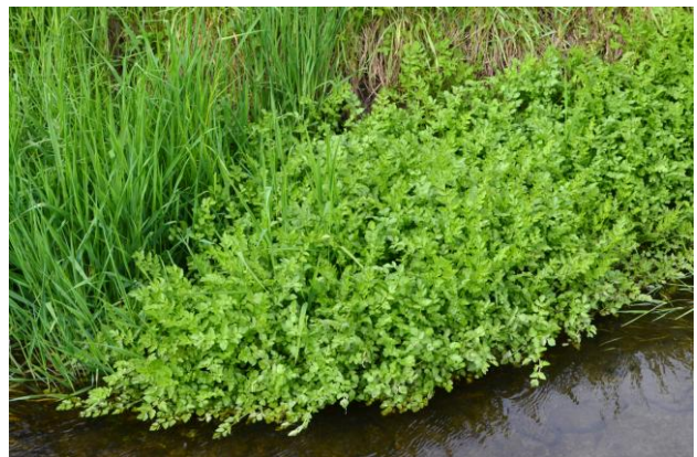
Lungo un canale (Piano di Magadino)