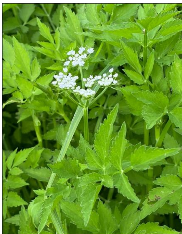
Oenanthe javanica