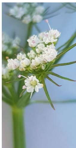
Ogni ombrelletta porta piccoli fiori biancastri con 5 petali