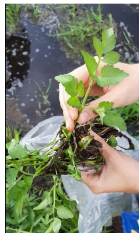
Intervento di lotta con eradicazione manuale sul Piano di Magadino (Cantone Ticino); nel 2018, in un canale con acqua poco profonda e a scorrimento lento