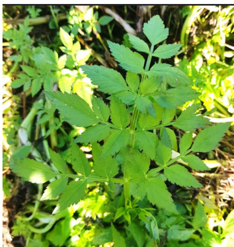
Foglia composta e pennata, di colore verde brillante, leggermente aromatica