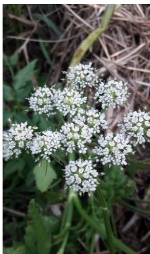
L'infiorescenza è una ombrella composta