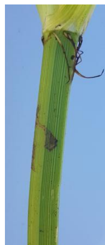
Stelo cavo e capace di radicare ai nodi