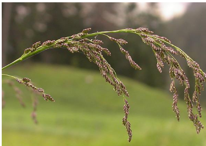
Dettagli delle infiorescenze