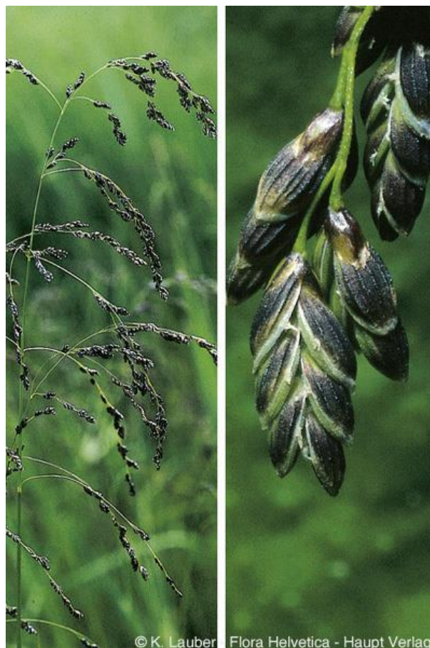
Glyceria striata