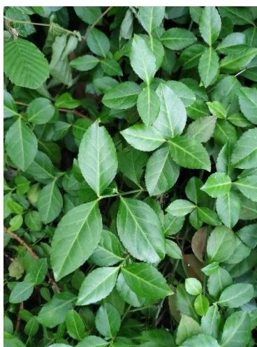
Foglie sempreverdi, coriacee e lucide.