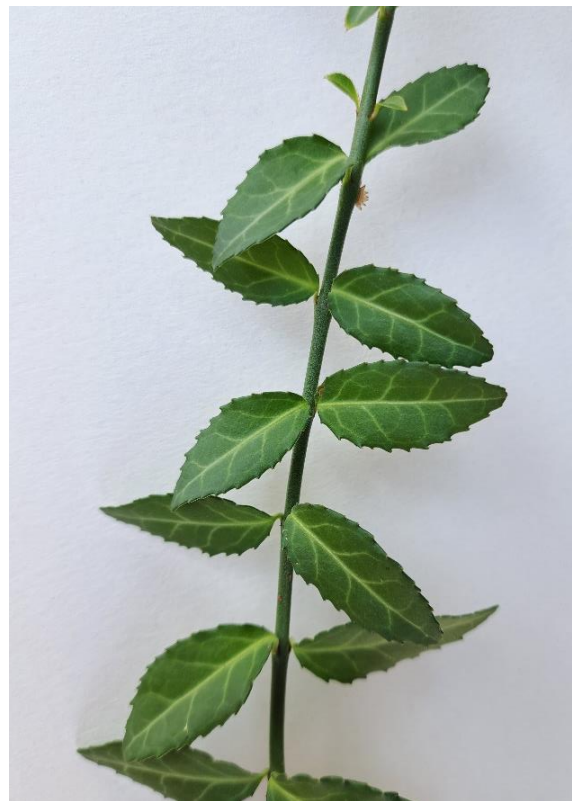
Euonymus fortunei