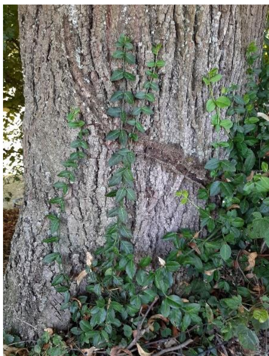
I fusti si arrampicano sulla vegetazione per mezzo di radici avventizie. (Thalwil)

Per quantificare l'impatto di questa specie sulla biodiversità in Svizzera è necessario eseguire degli studi mirati.