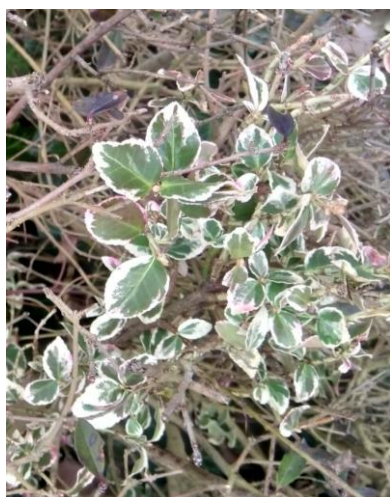
Esemplare con foglie variegata di bianco.