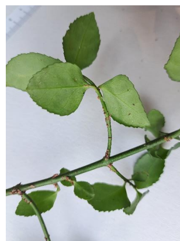
Ramoscelli arrotondati e radicanti ai nodi (var. radicans ). Nervature laterali non visibili.