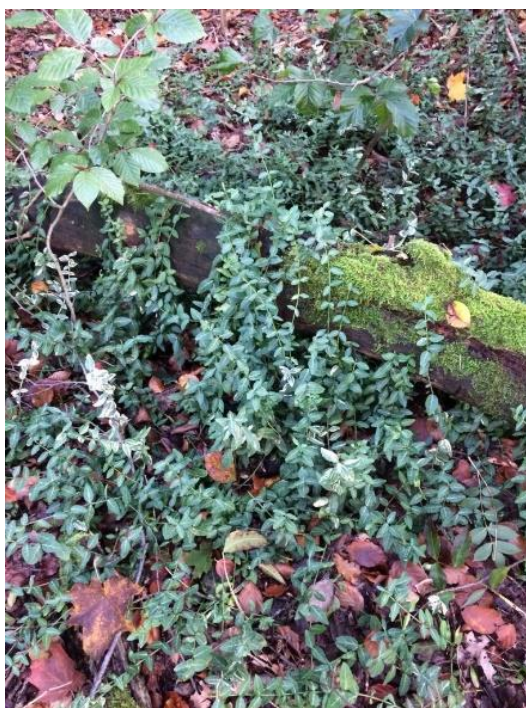
Fusti da prostrati a eretti si sviluppano nel sottobosco. (Berna, foto: André Strauss)