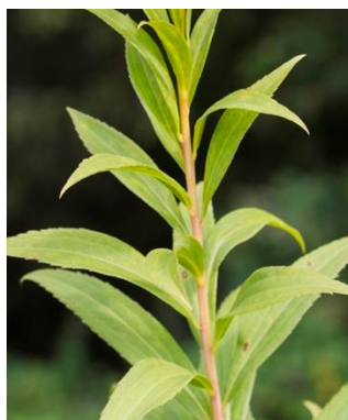
S. gigantea Tige glabre, rougeâtre dans la partie supérieure