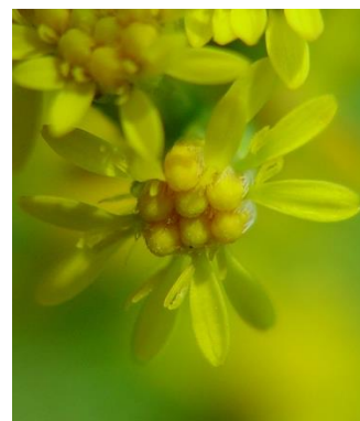
S. gigantea Fleurs ligulées plus longues que les tubulées