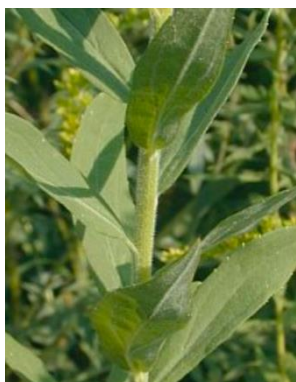
S. canadensis Tige verte, cotoneuse dans la partie supérieure