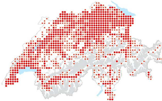
← Carte de distribution Info Flora de l'agrégat Solidago canadensis aggr.

Introduites d'Amérique du Nord comme plantes ornementales et mellifères, ces espèces vivaces se naturalisent facilement. Elles peuvent former des populations étendues et denses inhibant la végétation indigène.