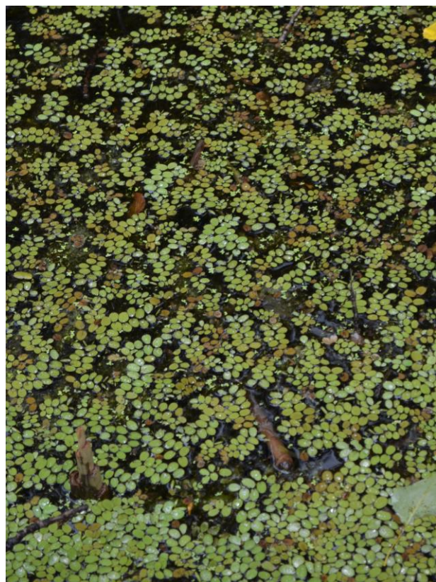
Salvinia molesta (Canton du Tessin)