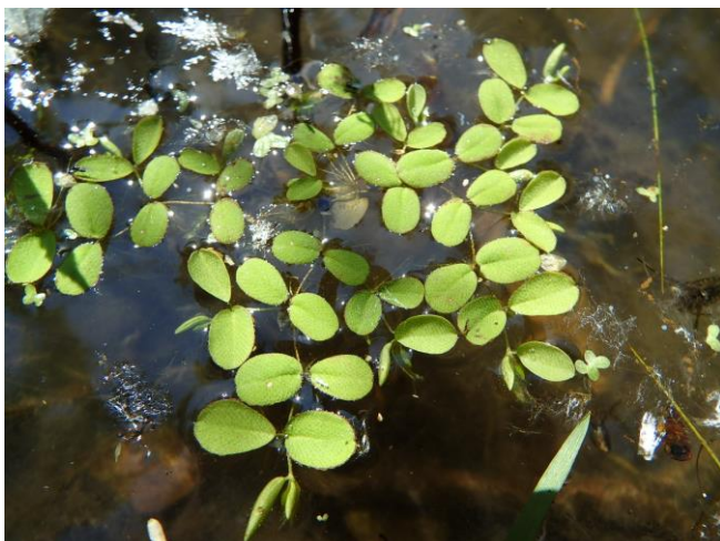
Morphologie de 2 ème phase