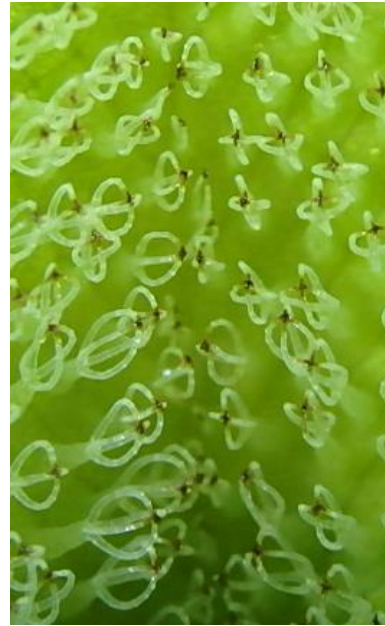
Trichomes courts insérés sur des papilles et soudés à l'apex