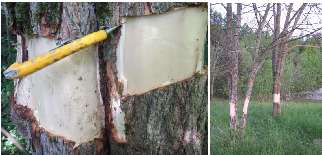
Des robiniers cerclés pour interrompre le retour des réserves dans les racines.