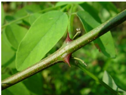
Aiguillons (=stipules des feuilles)