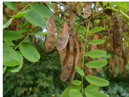
Fruit (=gousses)