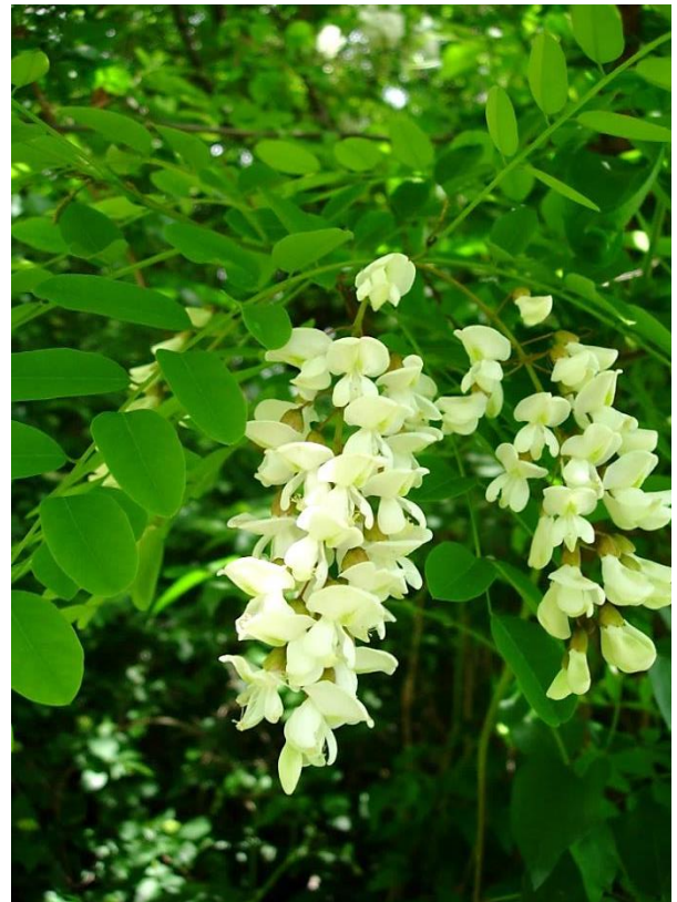
Robinia pseudoacacia