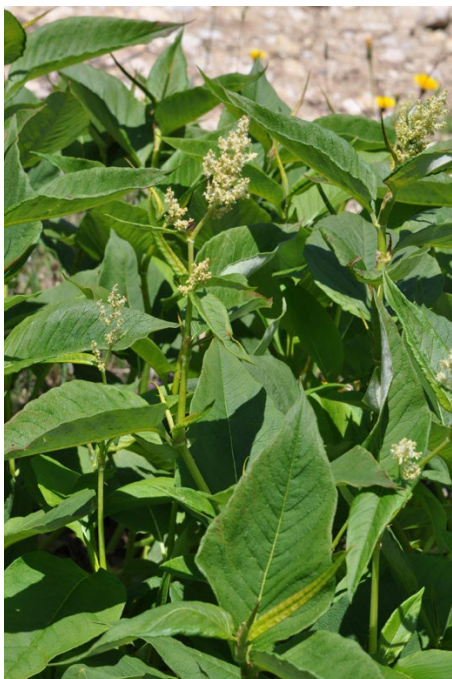
Renouée à épis nombreux en fleurs