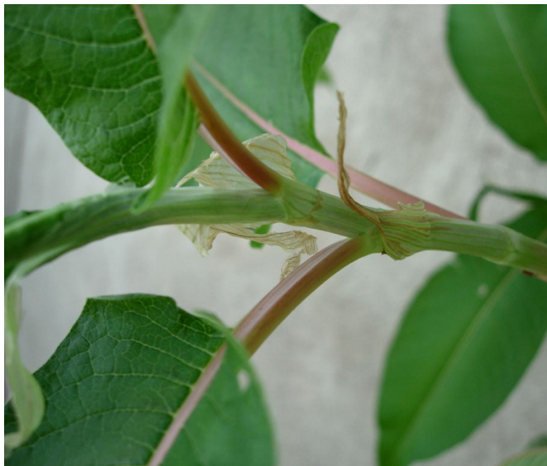
Ochréa à la base des pétioles des feuilles