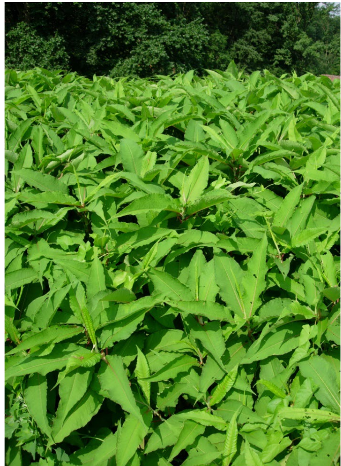
Polygonum polystachyum