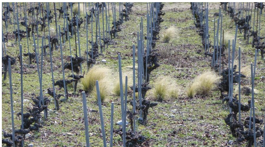
L'espèce Nassella tenuissima présente dans les vignes à Luins, Vaud.

En Suisse, N. tenuissima s'échappe également et facilement dans des endroits cultivés à haute valeur économique, comme les vignes (Françoise Hoffer, pers. comm. 2020), où il devient alors compliqué de lutter contre celle-ci.