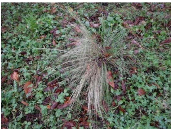
Nassella tenuissima au bord de la rivière Cassarate à Lugano (Tessin).

Floraison : la fin du printemps et durant l'été.