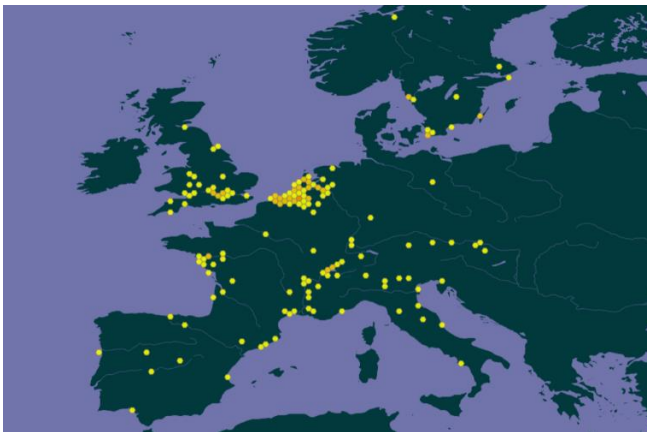
Distribution de Nassella tenuissima en Europe ( gbif.org )