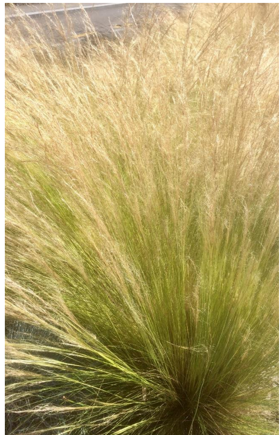
Nassella tenuissima et ses panicules de cheveux extrêmement fins (photo : Antoine Jousson).