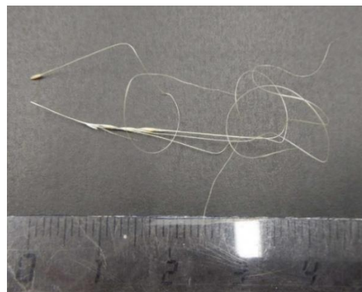
Le fruit simple (exemple ci-dessus) et l'inflorescence (exemple dessous) de Nassella tenuissima . Les glumes inférieures attachées au fruit présente une arête très longue.