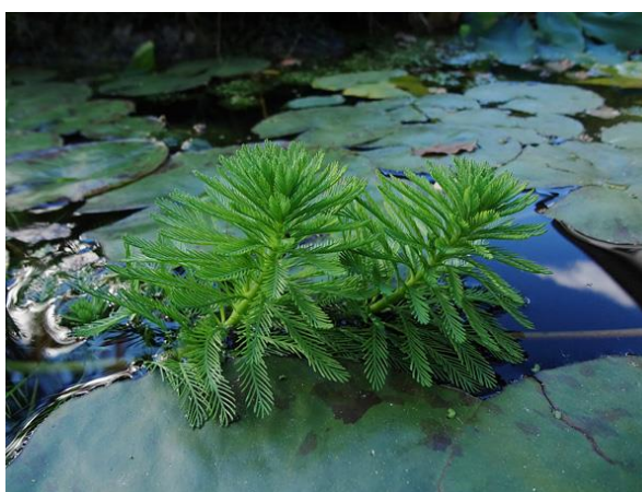
Myriophyllum aquaticum

Plante aquatique originaire du continent sud-américain (Argentine, Chili, Brésil), le myriophylle est une plante aquatique amphibie qui fut introduite dans différents endroits du monde du fait de la beauté de son feuillage. Cultivé en jardin botanique en France depuis 1880, son caractère invasif est observé dans des marais naturels à proximité de Bordeaux en 1913 déjà. Il a depuis colonisé toute la façade atlantique et a envahi une bonne partie de l'Europe de l'Ouest (Portugal, Espagne, France, Belgique, Autriche, Allemagne, Royaume Uni). Présentant une grande capacité d'adaptation, il a une croissance rapide et forme des populations denses et monospécifiques (100% de recouvrement).