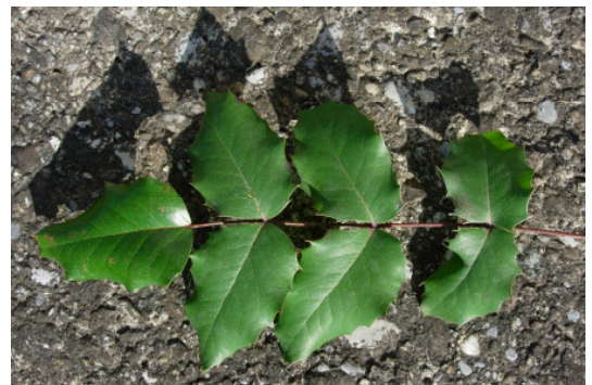
En haut: baies bleu foncé arrangées en grappe En bas: feuilles imparipennées