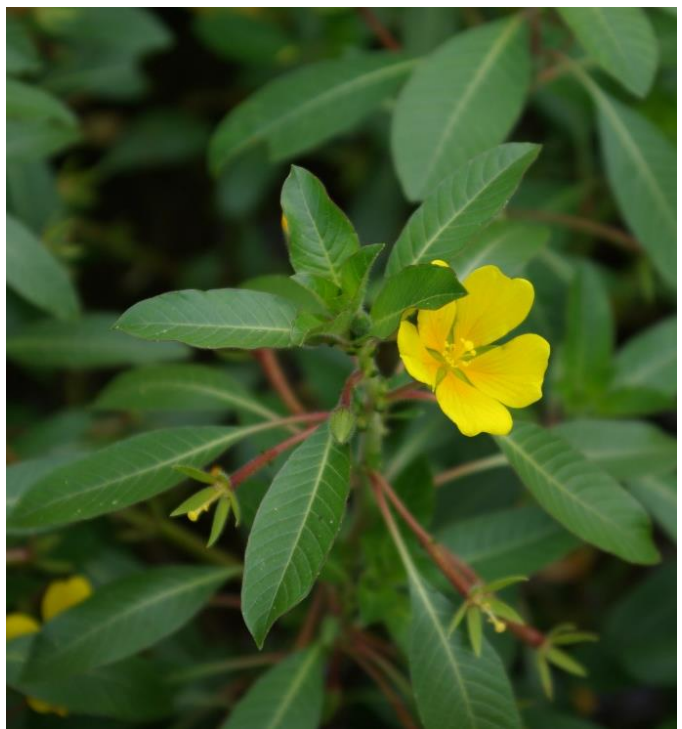
Ludwigia peploides