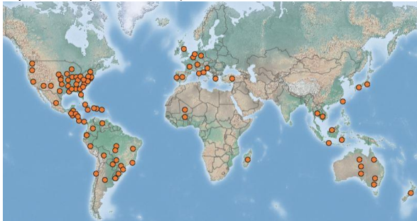
Distribution mondiale de Ludwigia peploides ( https://www.cabi.org/isc/datasheet/31673 )