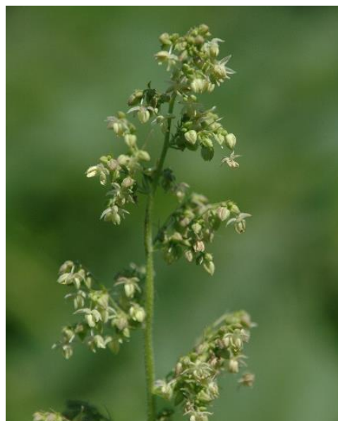
Inflorescences mâles