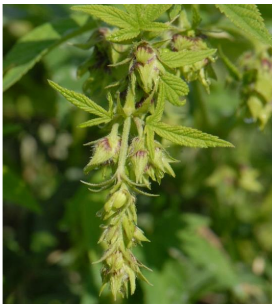
Inflorescences femelles