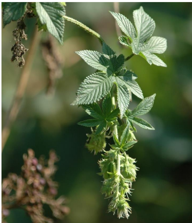
Inflorescences femelles