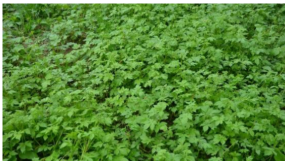
Populations monospécifiques de Humulus japonicus (France)

Originaire d'Asie de l'Est et introduit en Europe pour des raisons ornementales, le houblon du Japon [Syn. H. scandens ] est une liane annuelle non établie en Suisse. Avec une croissance très rapide et pouvant recouvrir complètement de grandes surfaces (peuplements denses monospécifiques), elle supprime ainsi les autres espèces. Les berges des rivières et milieux à la fois humides et ensoleillés, habitats riches en espèces, sont particulièrement touchés. L'espèce pose également des problèmes de santé publique car ses fleurs libèrent des grandes quantités de pollen responsables de réactions allergiques. L'espèce figure sur la liste des espèces invasives interdites de l'Union Européenne, ainsi que sur la liste A2 de l'EPPO (liste de recommandation pour la régulation et la quarantaine en Europe). Elle est notamment envahissante dans le nord de l'Italie (plaine du Pô) et au sud de la France.