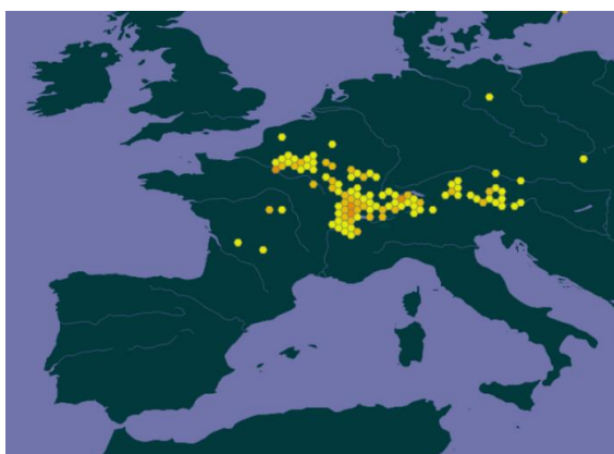
Carte de distribution en Europe ( gbif.org )