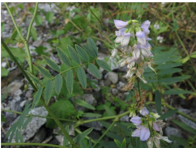
Galega officinalis