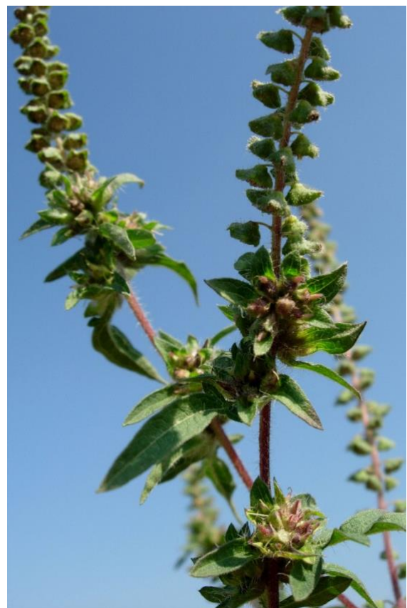
Inflorescence mâle et femelle