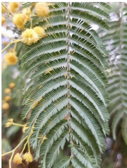
Détails de la feuille bipennée