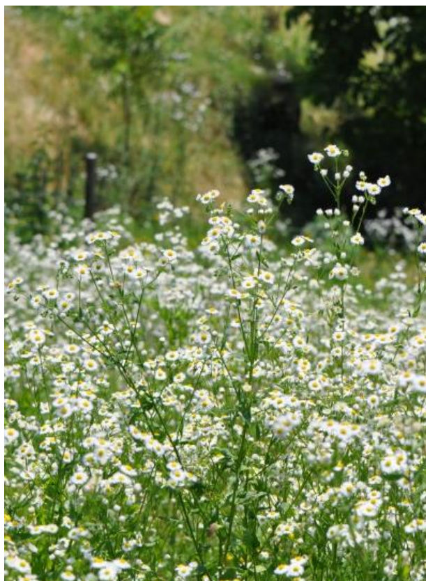
Erigeron annuus