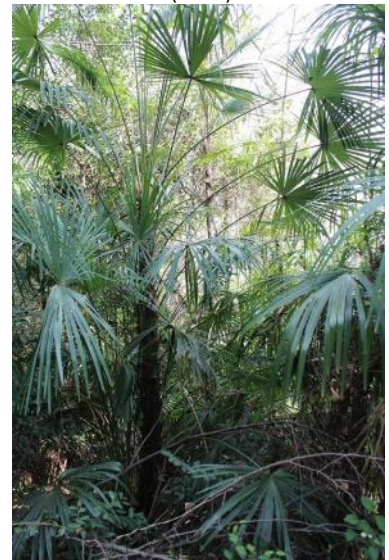
Junges Individuum in Schattenlage