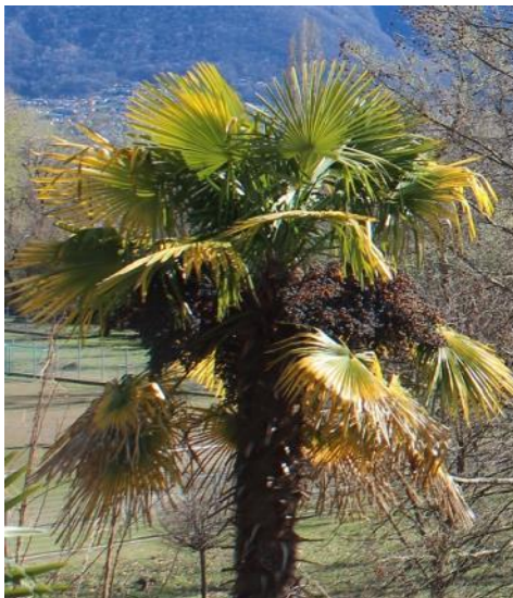
Weibliche Palme mit reifen Früchten