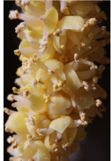
Männliche Blüten (zoom)