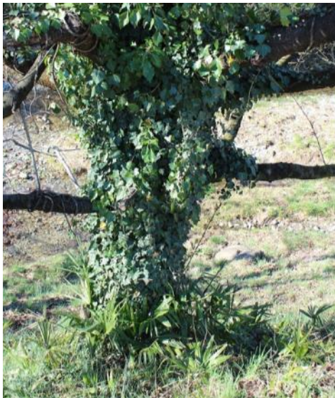
Junge Palmen unter einem Baum