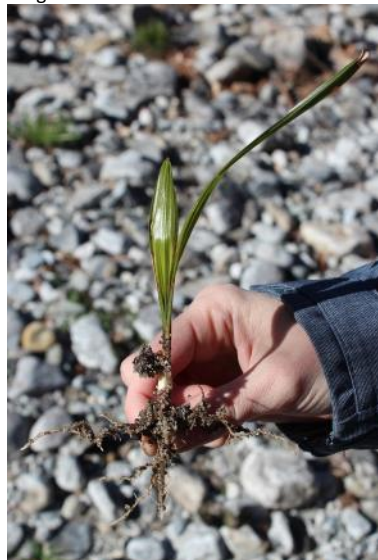
1-2 jährige junge Pflanze