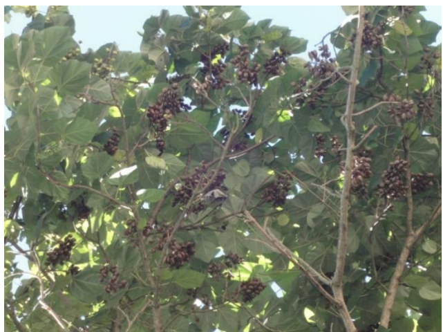
Paulownia tomentosa