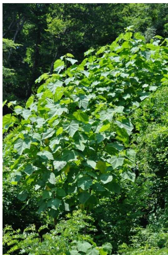
Paulownia tomentosa