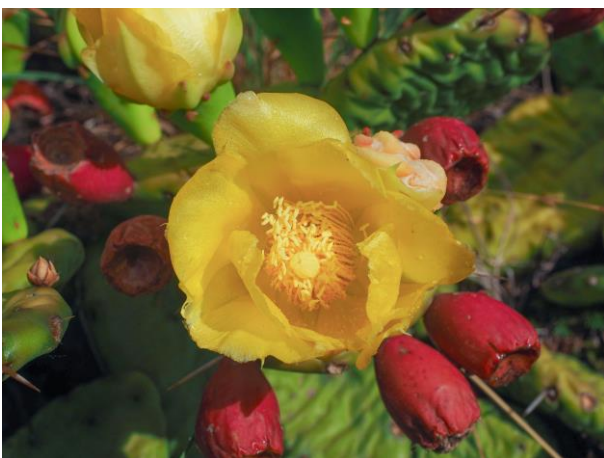
Gelbe Blüte und rote Früchte