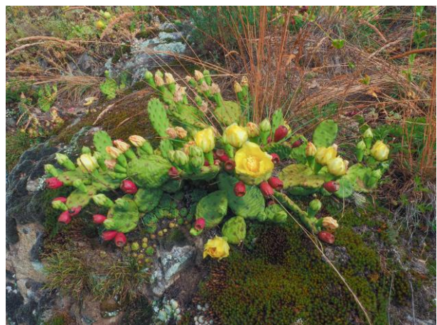
Mehr oder weniger niederliegende, kriechende Wuchsform