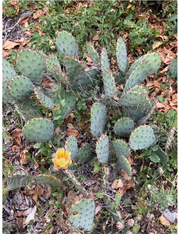
Mehr oder weniger niederliegende Wuchsform mit 2 bis 4 aufrechten Stängelgliedern