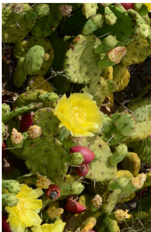
O. humifusa