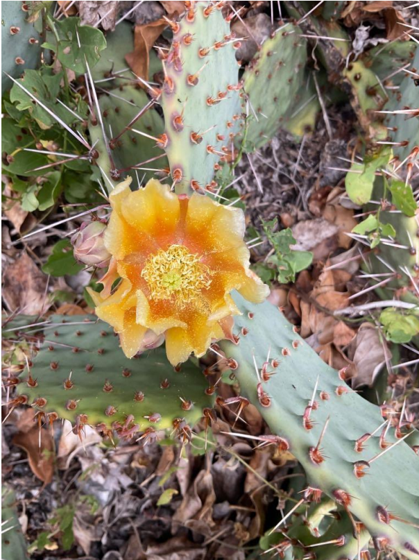
Gelbe Blüten mit rot-orangem Zentrum