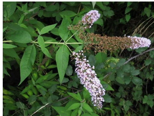
Blütenstand von Buddleja davidii