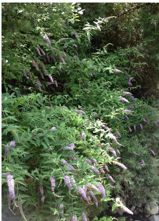
Buddleja davidii