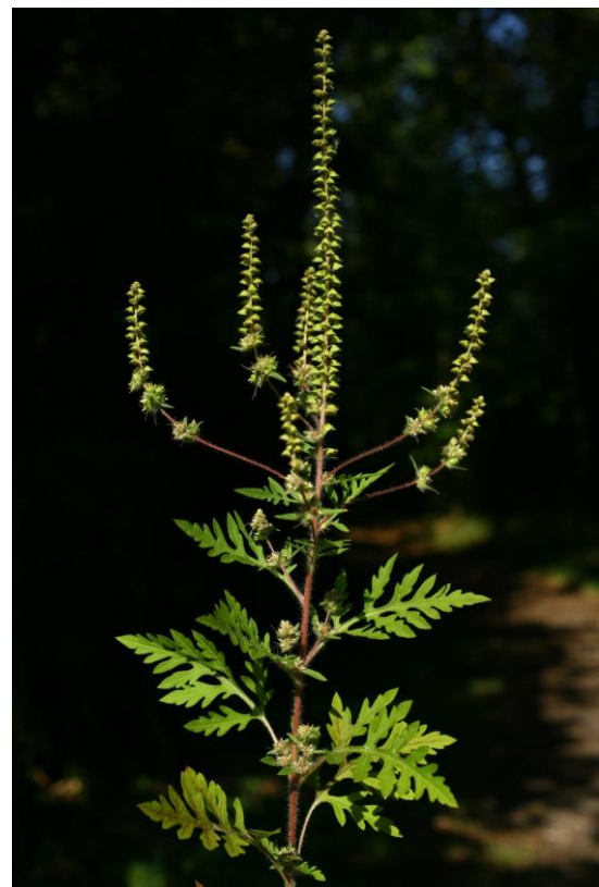
Ambrosia artemisiifolia