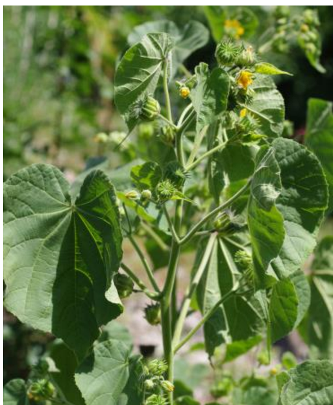
Abutilon theophrasti (Foto: Joëlle Magnin-Gonze)