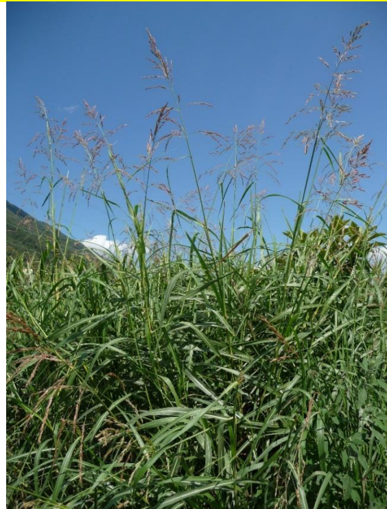
Sorghum halepense