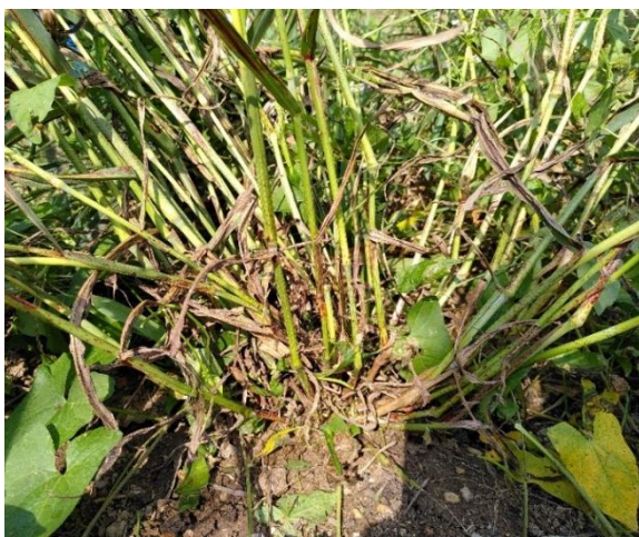
Chaumes de Sorghum halepense