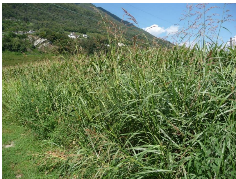
Sorghum halepense (Gudo TI)

Le sorgho d'Alep pose d'importants problèmes au niveau de l'agriculture par compétition et par mécanismes allélopathiques (Warwick & Black, 1983; Nouri et al. 2012; Huang et al. 2017). Dans les pays voisins et en Suisse, il est principalement retrouvé dans les champs de maïs ( Zea mays L.) et du potiron ( Cucurbita pepo L.), mais aussi et dans une moindre mesure, dans les champs de pommes de terre ( Solanum tuberosum L.), les vignes ou encore dans les terrains laissés en jachère (Follak & Essl, 2013). Lorsque les foyers de contamination sont importants, des pertes significatives de récoltes sont à déplorer (jusqu'à 88 % dans le pire des cas) et une augmentation des coûts des traitements chimiques et mécaniques sont engendrés (Vila-Aiub et al. 2012; Follak & Essl, 2013; Peerzada et al. 2017). Des réductions de la valeur des récoltes allant jusqu'à des dizaines de millions de dollars par an ont été estimées pour certains États des États-Unis. De plus, le sorgho d'Alep sert de réservoir à un bon nombre de pathogènes divers (virus, champignons, insectes, nématodes), notamment au virus de la mosaïque du maïs qui affecte la production de celui-ci au niveau mondial (Follak & Essl, 2013).