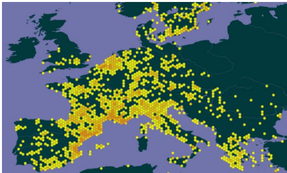
Carte de distribution de Sorghum halepense en Europe ( gbif.org )

Lien vers la carte de distribution Info Flora