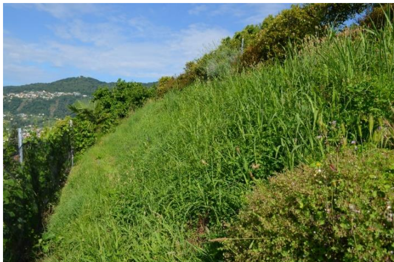
Sorghum halepense entre les vignes à Muzzano (TI)