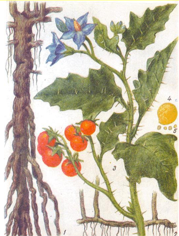
Solanum carolinense : système racinaire ; partie aérienne, fleurs et baies ; graines (Guide on quarantine and other dangerous pests, diseases and weeds, 1970).

← Répartition potentielle (OFEV, Uni Lausanne)