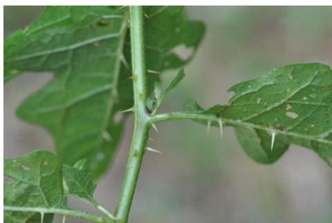
Épines le long des tiges, du pétiole et sur la nervure des feuilles