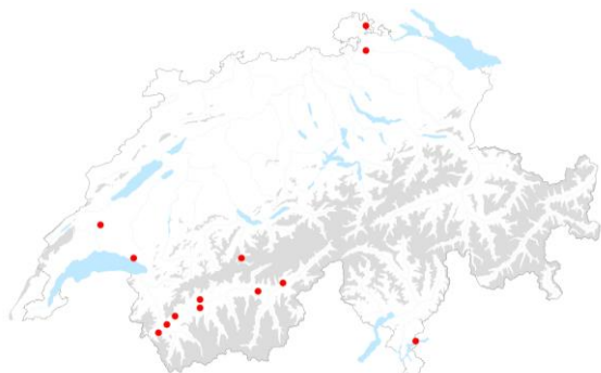
O. phaeacantha , lien vers la carte de distribution InfoFlora