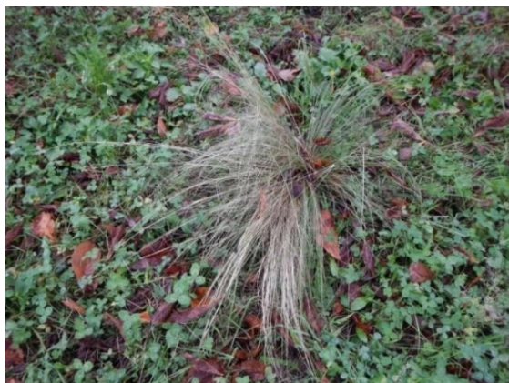
Nassella tenuissima au bord de la rivière Cassarate à Lugano (Tessin).

Floraison : la fin du printemps et durant l'été.