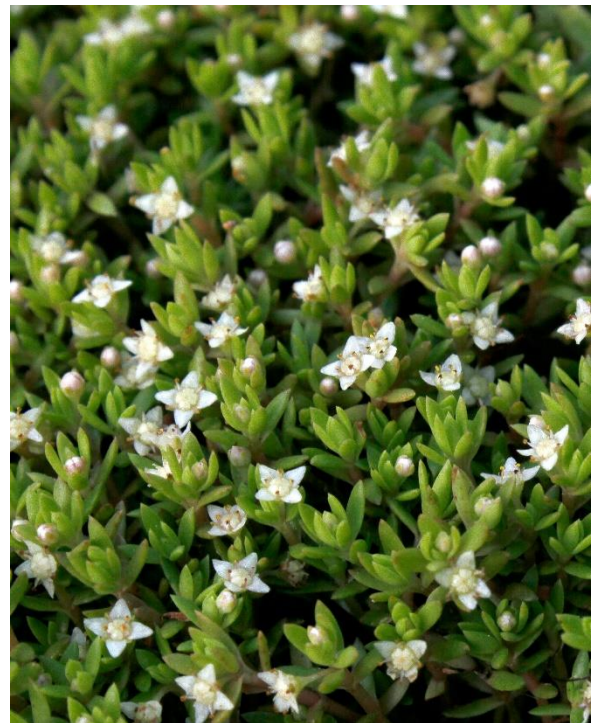
Crassula helmsii

Carte de distribution de Crassula helmsii en Europe