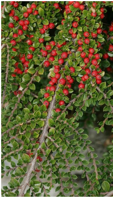
Rameaux distiques