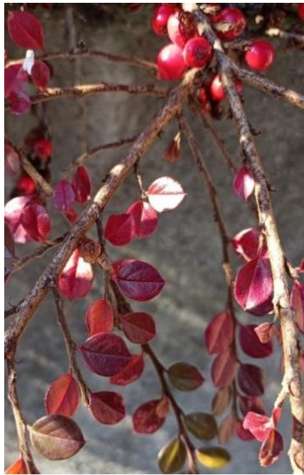
Feuilles rougissant à l'automne