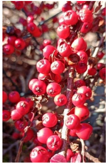
Fruits mûrs de couleur rouge