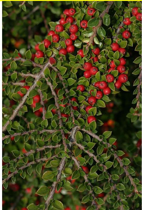
Cotoneaster horizontalis