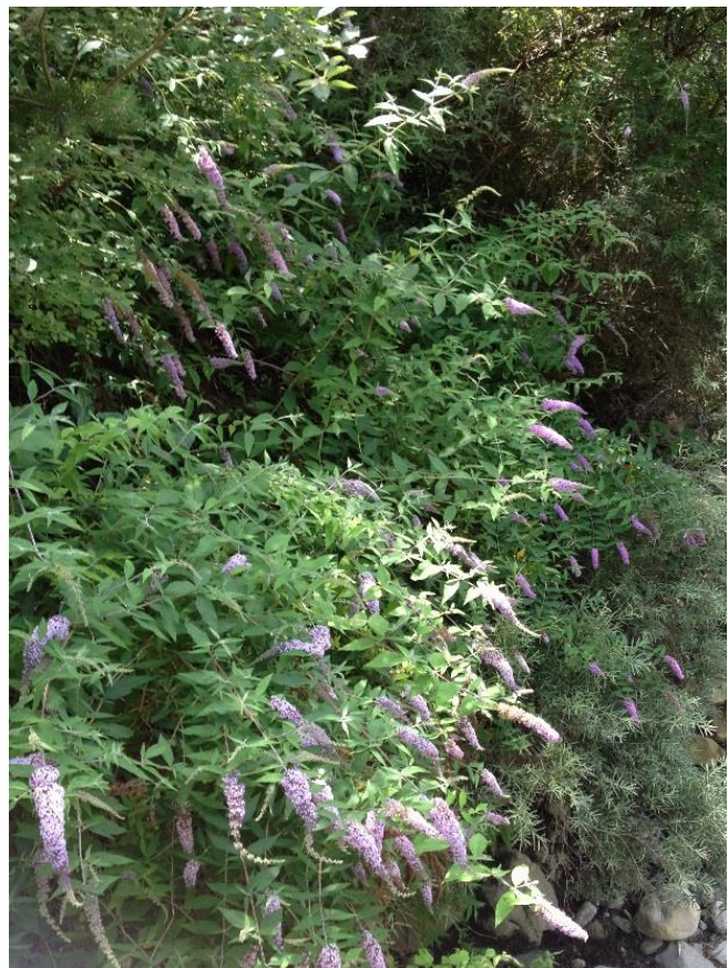
Buddleia davidii