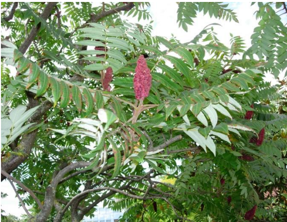
Aufrechte Fruchtstände: Junge Äste dicht behaart