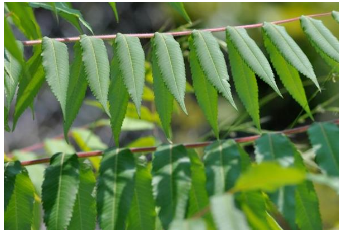
Teilblätter gezähnt