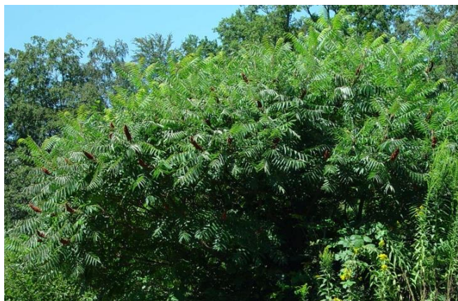
Rhus typhina in Blüte