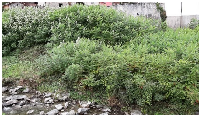
Population von Rhus typhina