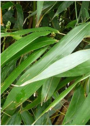
Blätter von P. aurea