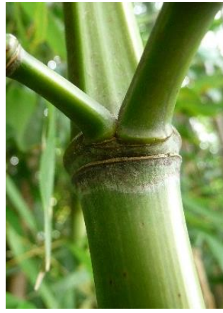
Äste paarig, ungleich angeordnet