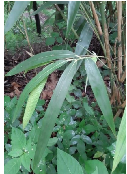
Blätter von P. japonica