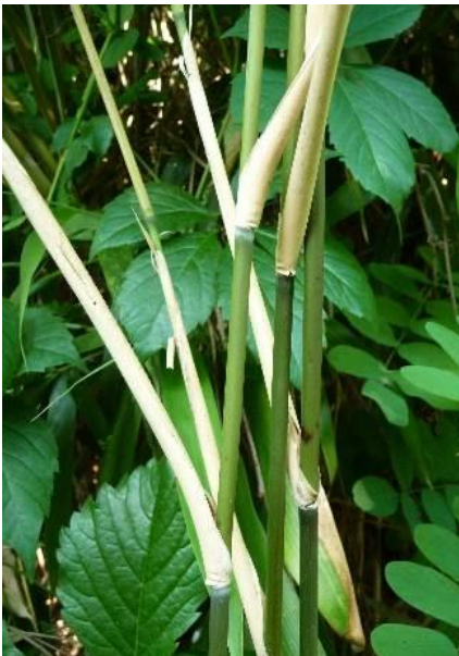
Internodien und bleibende Blattscheiden von P. japonica