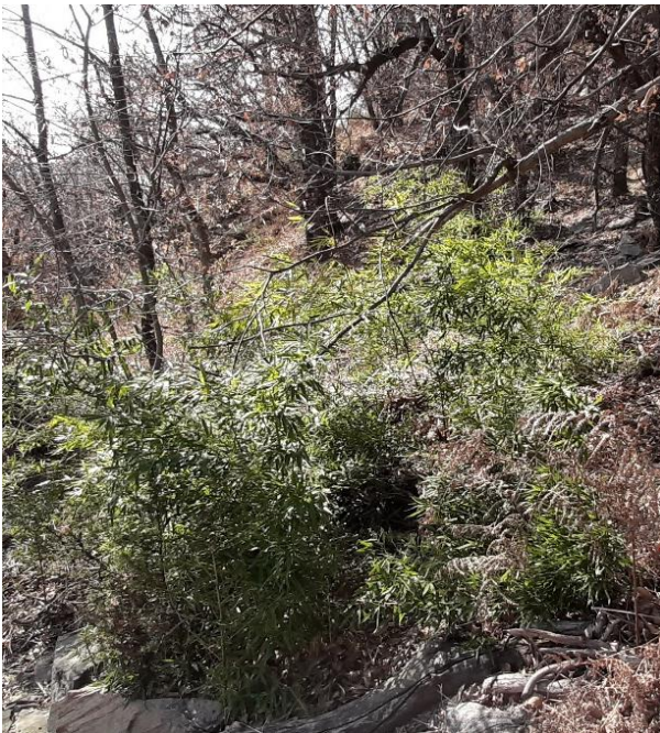
Frei im Garten ausgepflanzte Bambuspflanzen verwildern leicht. Oft kommen sie in den Wäldern auch durch illegal entsorgte Gartenabfälle vor.

Die Eintrittspforte in die Schweiz bildet die Verwendung von Bambus als Zierpflanze . Der Bambus kommt in allen Regionen der Schweiz vor, insbesondere in den Tessiner Wäldern, jedoch auch auf der Alpen-Nordseite und in den Nachbarländern (z.B. in Baden-Württemberg, Deutschland; Rüttbauer, 2018). In den Wäldern werden Rhizomfragmente aufgefunden, insbesondere durch illegale Ablagerungen von Gartenabfällen (Hohla, 2018; Rüttbauer, 2018). Verwilderte Vorkommen befinden sich hauptsächlich in der Nähe von Gärten, es werden jedoch immer mehr Standorte in Wäldern, fernab der Gärten, festgestellt. Die Rhizomstücke werden mit kontaminiertem Erdmaterial , jedoch auch durch Hangrutsche und Überschwemmungen (Transport der Teilstücke mit der Strömung) verbreitet. Kleine Rhizomteile sind in der Lage, innerhalb von nur wenigen Jahren einen dichten, monospezifischen Bestand zu bilden.