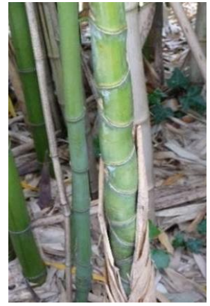
Gestauchte Internodien erscheinen aufgeblasen