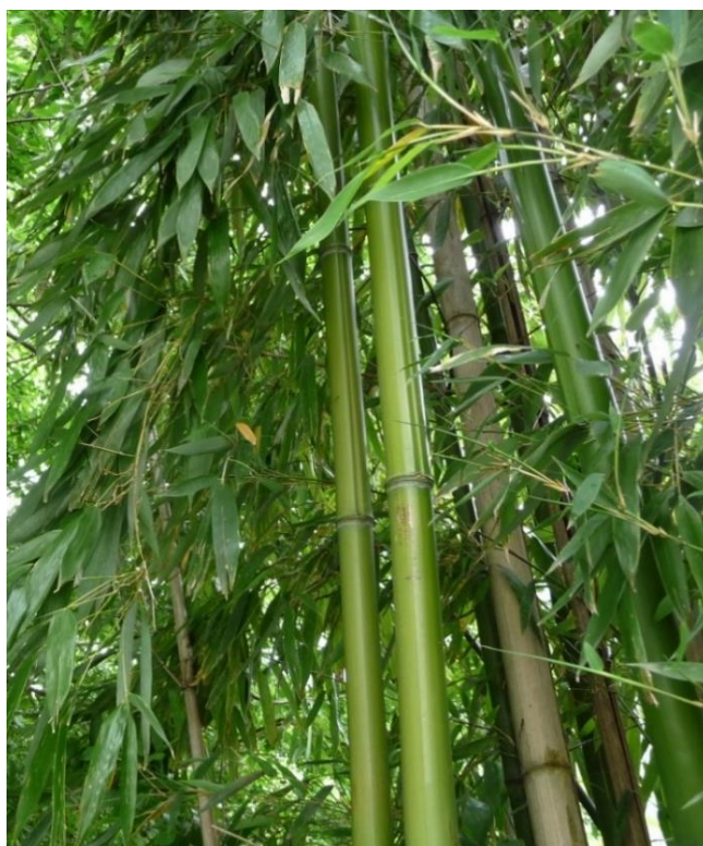
Phyllostachys aurea