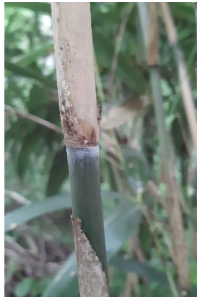
Detailansicht der Knoten