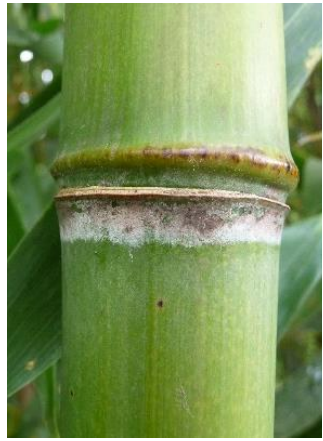
Knoten mit Ringwulst