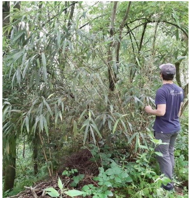
Lokal kann der Bambus aufgrund seiner hohen vegetativen Ausbreitungsfähigkeit sehr dichte und undurchdringliche Bestände bilden (TI).