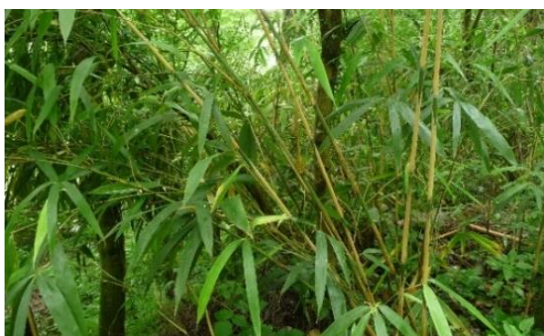
Pseudosasa japonica

Link zur Info Flora Verbreitungskarte von P. japonica (und zur Verbreitungskarte von P. aurea )