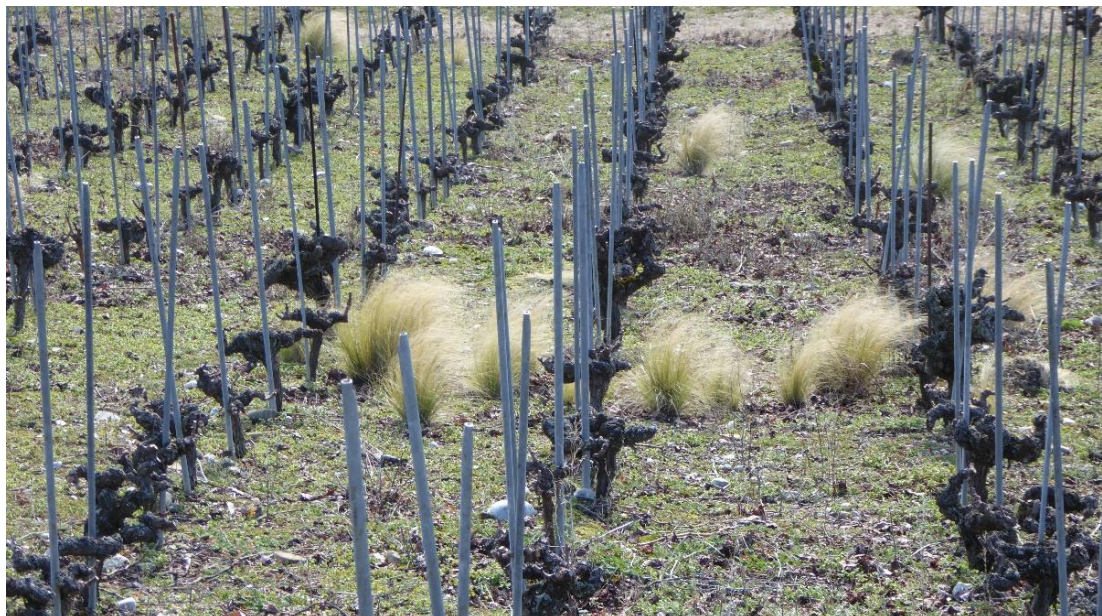
Nassella tenuissima in den Weinbergen von Luins, Waadt.

In der Schweiz verwildert N. tenuissima auch rasch in Anbauflächen von hohem wirtschaftlichem Wert, wie z. B. in Weinbergen (Françoise Hoffer, pers. Komm. 2020), wo seine Bekämpfung aufwändig ist.