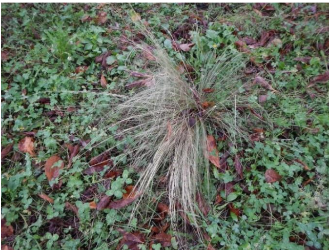
Nassella tenuissima am Ufer des Cassarate Flusses bei Lugano, Tessin.

Blütezeit: Spätes Frühjahr bis Hochsommer.