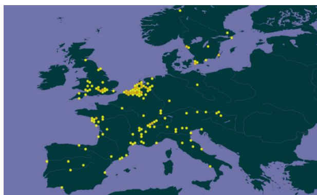
Verbreitung von Nassella tenuissima in Europa ( gbif.org ).