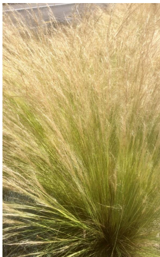
Nassella tenuissima . Die Rispen geben dem Gras das Aussehen von zarten «Federn».