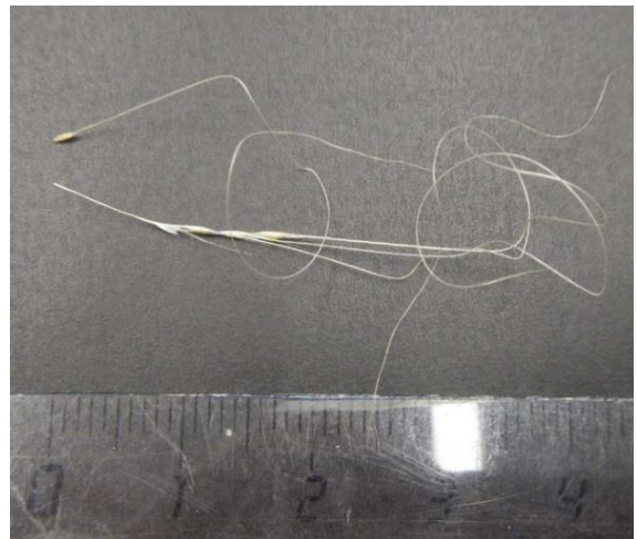
Frucht: Einsamig mit sehr langer Granne.