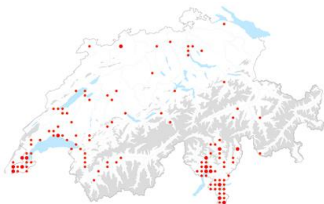
Link zur Info Flora Verbreitungskarte

Diese aus Ostasien stammende Pflanzenart kommt hauptsächlich im Tessin vor. Mit zunehmender Häufigkeit ist sie jedoch auch im Mittelland und in der Westschweiz zu beobachten. Sie besiedelt Waldlichtungen, Strassenränder und ruderale Lebensräume. Lokal bildet sie dichte Bestände, die die einheimische Vegetation verdrängen.