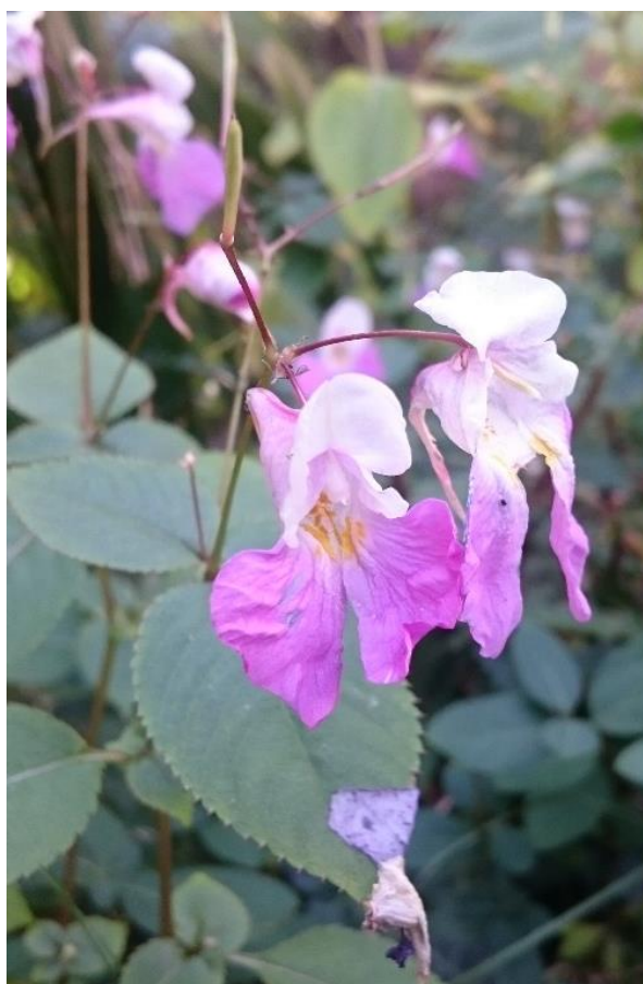
Impatiens balfourii