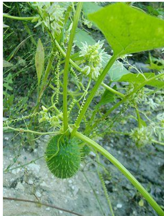
Echinocystis lobata