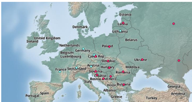
● invasiv / ● nicht präsent, CABI Verbreitungskarte

Die Stachelgurke stammt ursprünglich aus Nordamerika und ist dort ein gefürchtetes Unkraut in Mais- und Sojabohnenkulturen. In Mitteleuropa besiedelt sie bevorzugt nährstoffreiche Böden in sommerwarmen Gebieten. Es handelt sich um eine schnell kletternd wachsende Pflanzenart (6 m/Jahr), die die Bäume entlang von Flussufern überwächst und an Waldrändern und in gestörten Lebensräumen (Verkehrswege, Ödland) vorkommt. In der Schweiz wurde die Art noch nicht beobachtet.