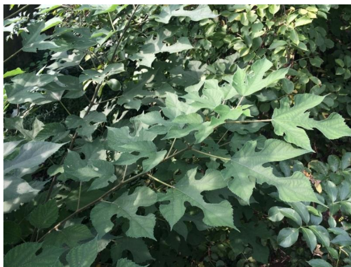
Broussonetia papyrifera bei Beride (Tessin)