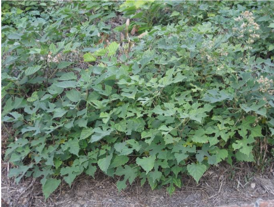
B. papyrifera am Monticello d'Alba (Piemont, Italien)

Der Papiermaulbeerbaum ist in den Nachbarländern, insbesondere in Frankreich und Italien , häufig (Banfi & Galasso, 2010; Montagnani et al. 2018). In Italien wird er aus fast allen Regionen gemeldet, insbesondere aus Friaul-Julisch Venetien , der Lombardei und dem Piemont . Im Piemont ist die Art in die Massnahmenliste für invasive Arten aufgenommen worden. In der Schweiz kommt sie vor allem im Kanton Tessin vor (Mangili et al. 2018). Ihre starke Ausbreitungsfähigkeit über Wurzelfragmente (kontaminierter Boden) könnte in Zukunft zu einer schnellen und problematischen Ausbreitung führen.