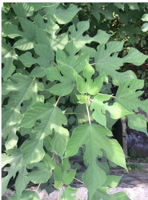
Charakteristische Blattform der oberen Blätter