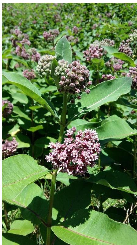
Asclepias syriaca