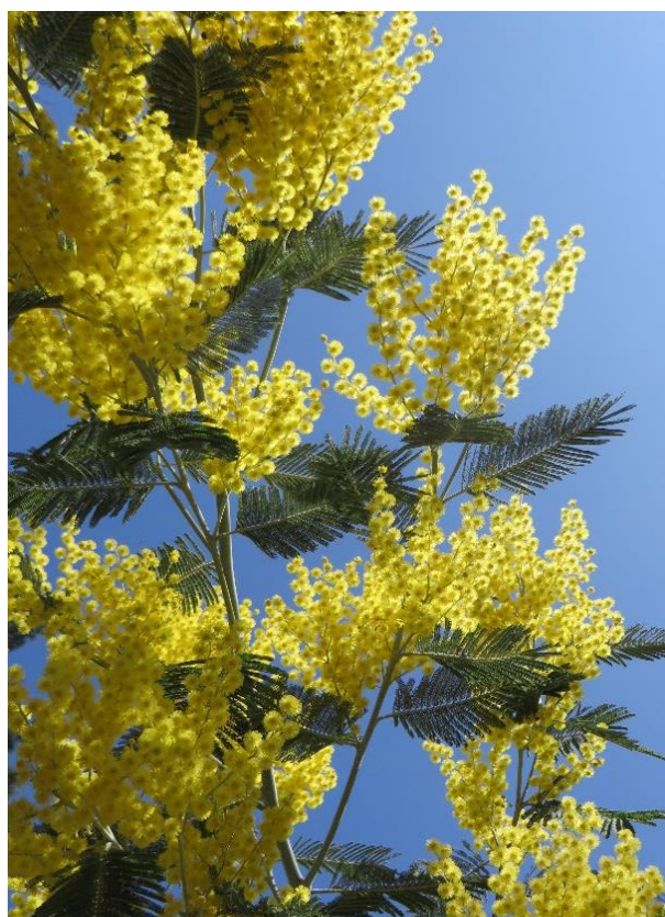
Acacia dealbata