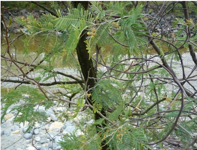
Ufer des Melezza (TI)