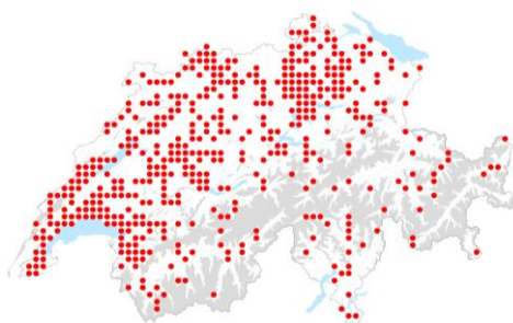
S. spurium : link per la cartina di distribuzione InfoFlora

La borracina caucasica e la borracina stolonifera (note anche con i sinonimi Phedimus spurius e P. stoloniferus ) sono state introdotte come piante ornamentali, in particolare per le loro qualità tappezzanti. A causa della crescita molto vigorosa e dei loro stoloni, sono in grado di sfuggire con facilità dai giardini e di competere con le specie autoctone. Entrambe le specie possono formare popolamenti densi nelle praterie secche e nelle aree rocciose, ambienti di alto valore ecologico, danneggiando la flora locale. La borracina stolonifera è anche una pianta problematica nelle praterie estensive ed intensive in quanto danneggia l'economia locale. Il controllo delle due borracine esotiche è molto difficile a causa dei frammenti di fusto che rimangono nel terreno.