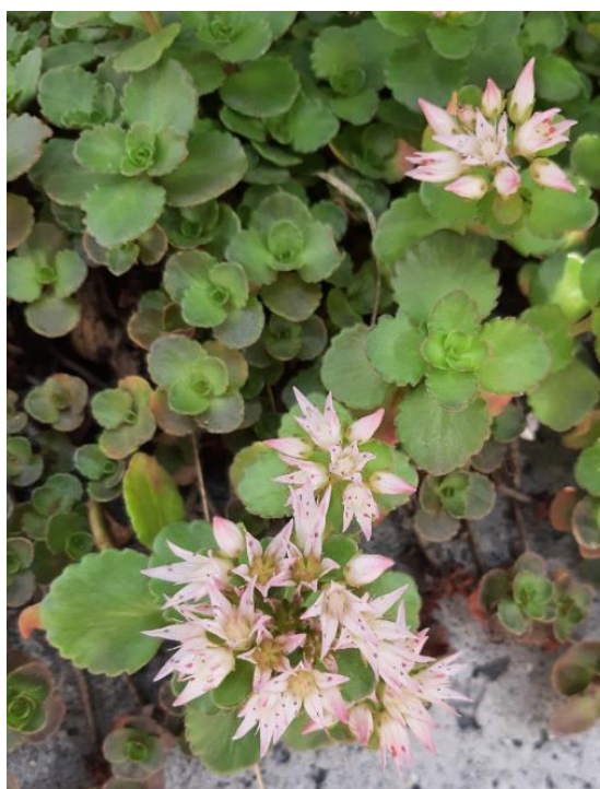
Sedum stoloniferum