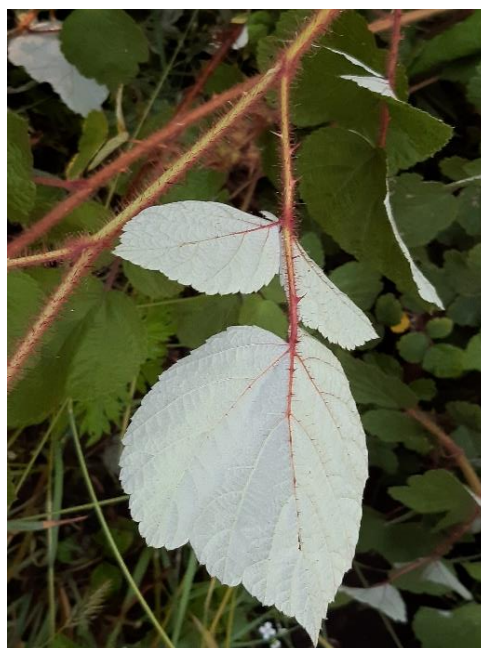
Parte inferiore tomentosa di colore biancastro