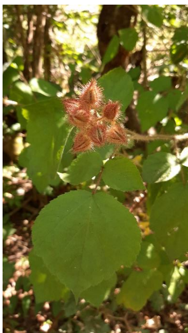
Racemi pelosi caratteristici della specie