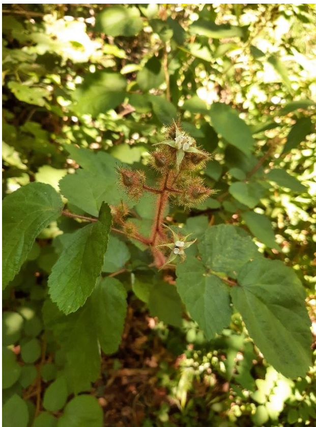
Racemo peloso di Rubus phoenicolasius .