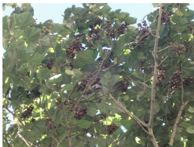
Foglie e frutti