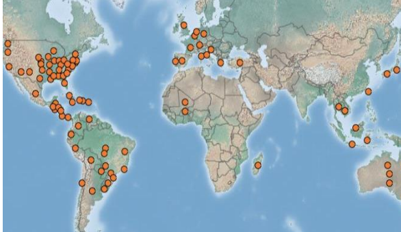
Distribuzione mondiale di Ludwigia peploides ( https://www.cabi.org/isc/datasheet/31673 )