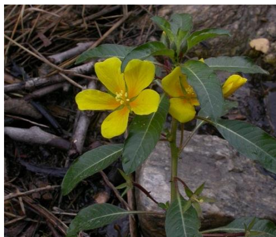
Steli eretti con fiori di Ludwigia peploides