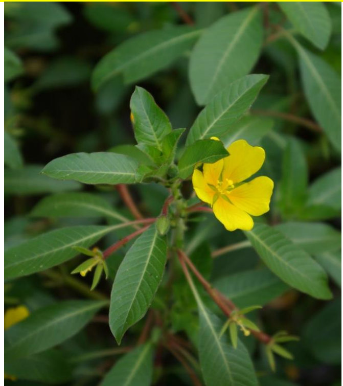
Ludwigia peploides