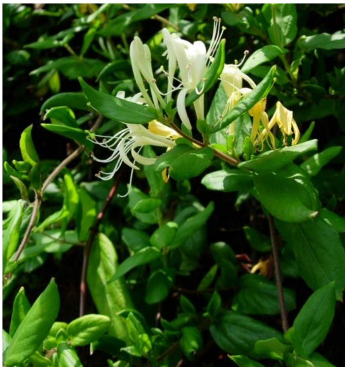
Lonicera japonica