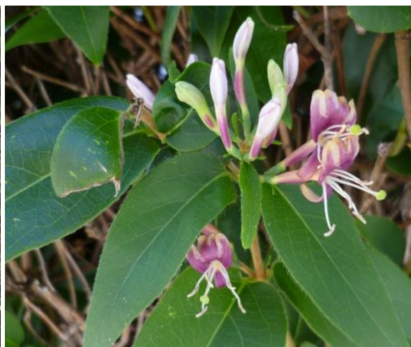
Fiori a coppie alla fine del ramo