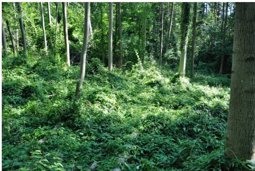
Lonicera henryi