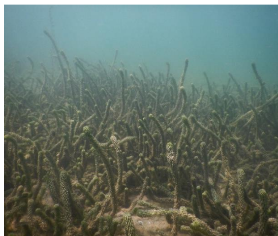
...e nel lago di Lugano