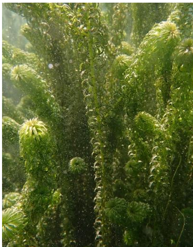
Lagarosiphon major