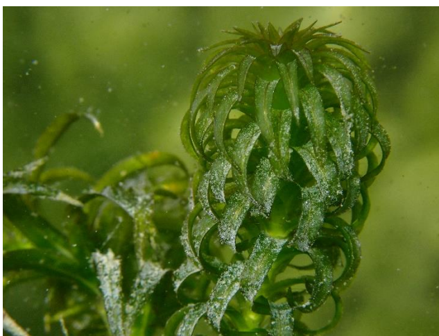
Dettagli di steli e foglie. (Lago Lemano, La Tour-de-Peilz, Vaud).