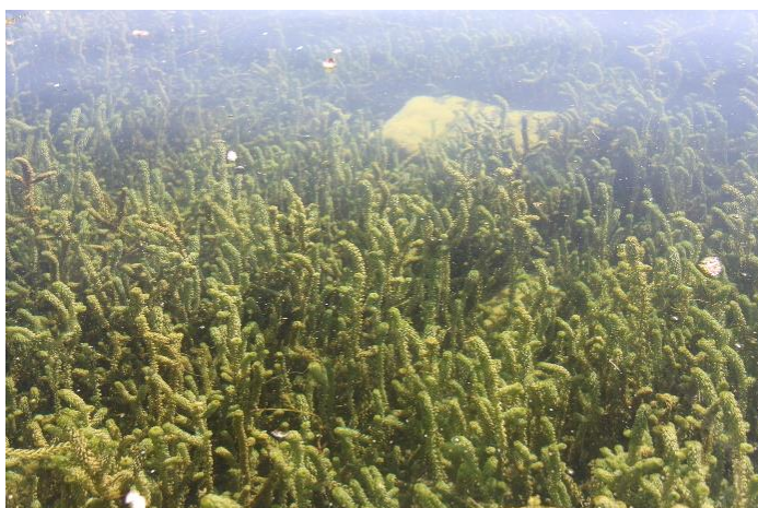
Densa popolazione di L. major nel Lago Lemano...