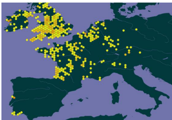
Cartina di distribuzione in Europa ( gbif.org )

Link per la cartina di distribuzione Info Flora