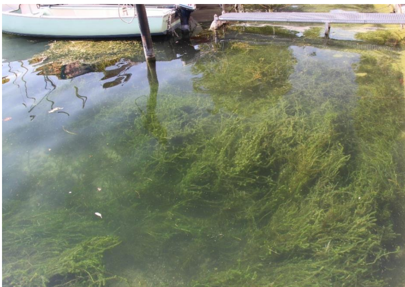
L. major che ricopre completamente il fondo del lago (La Tour-de-Peilz, Vaud). Il rischio di una diffusione di frammenti di fusto fragili è elevato.

In Svizzera , la specie colonizza i grandi laghi con acque calme, la maggior parte dei quali sono poveri di calcare. Predilige in particolare i porti , dove trova le condizioni ideali (nutrienti e correnti deboli). Il fenomeno dell'espansione all'interno dei porti rappresenta un rischio elevato e sempre maggiore per la dispersione dei frammenti di fusti (trasporto involontario), come osservato per esempio nel Lago Lemano (Adrian Möhl, pers. comm. 2021) e nel Canton Ticino (Luca Paltrinieri, pers. comm. 2021).