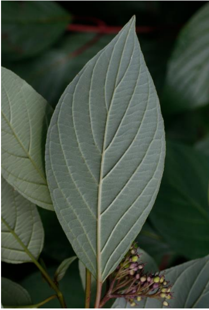
Foglie grigio-verdi nella parte inferiore, con 5-7 paia di nervature arcuate.