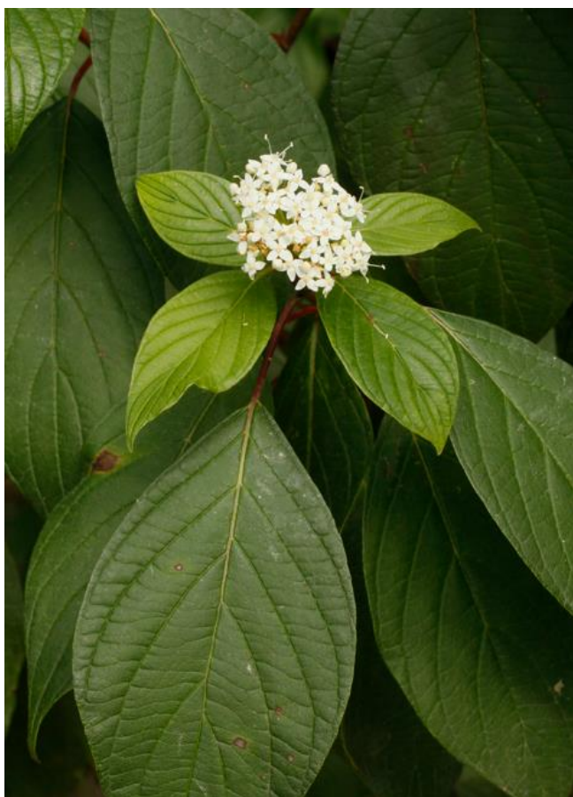
Cornus sericea