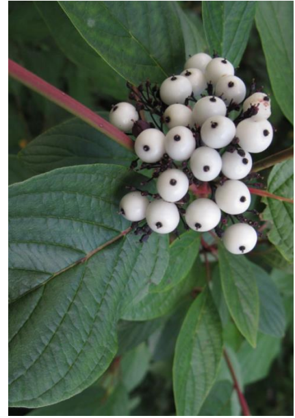
Frutti (drupe) biancastri o grigio chiaro.