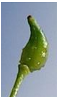
Frutto allungato a forma di becco.