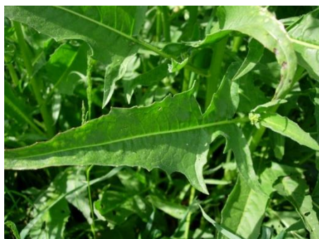
Foglie inferiori pennatopartite con lobo terminale triangolare.