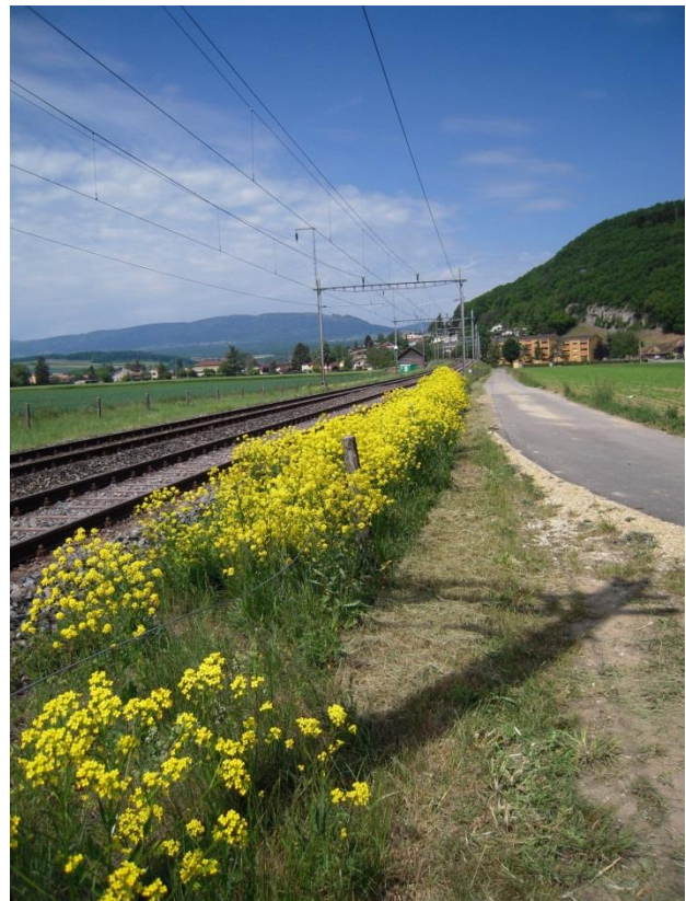
Bunias orientalis