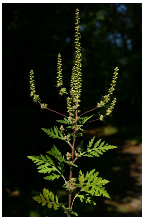
Ambrosia artemisiifolia