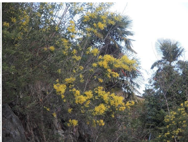
Su un pendio soleggiato a Moscia (TI)