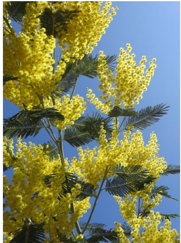
Acacia dealbata