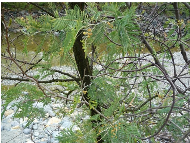
Lungo la riva del fiume Melezza (TI, foto: Antoine Jousson)