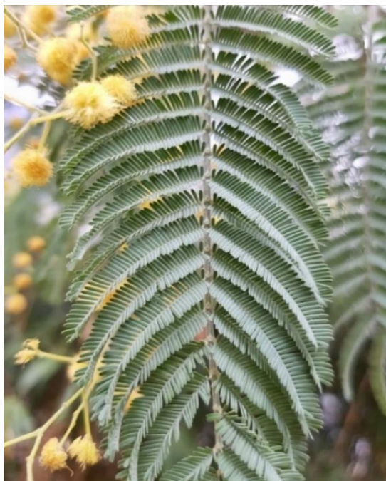
Dettagli della foglia bipennata.