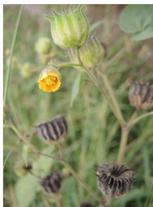
Fiore e frutti