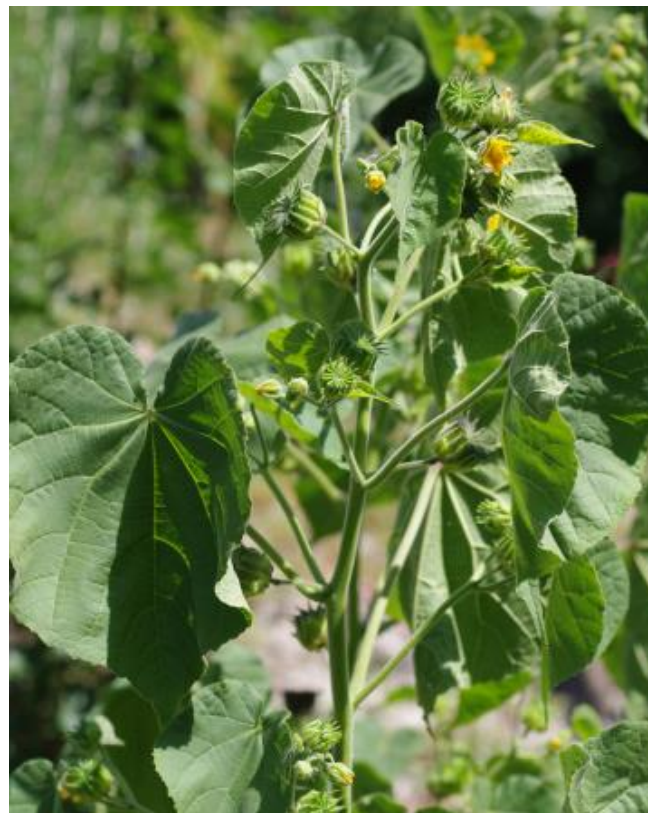
Abutilon theophrasti