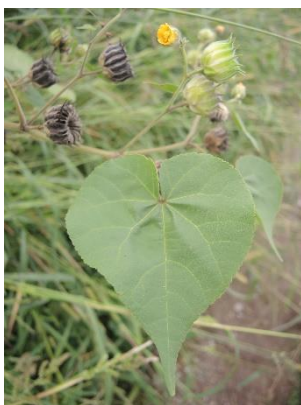
Foglia a forma di cuore