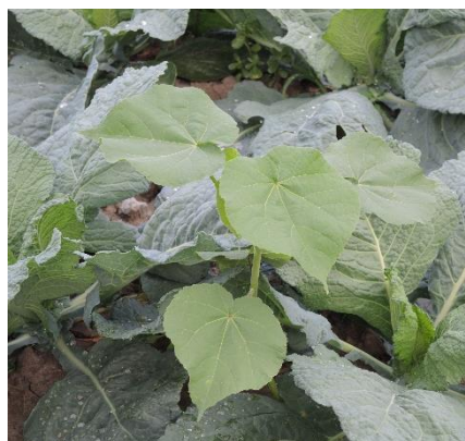
Giovane pianta